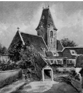
Pleyels Taufkirche mit seinem Geburtshaus in Ruppersthal/NÖ, Niederösterreichische Landesbibliothek, topografische Sammlung

Thanks to the Pleyel Society's new edition of the Symphonie Concertante based on the original manuscript, one of Pleyel's crowning achievements is finally available in both versions for study and performance.