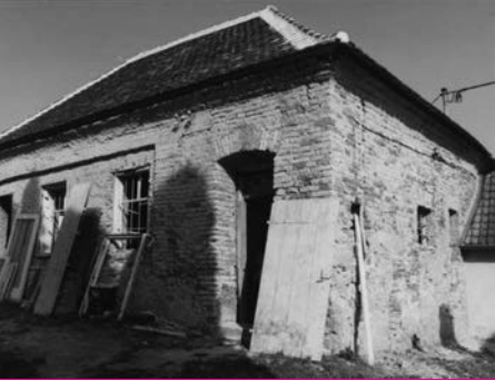
Geburtshaus – Birthplace als eine Ruine – as a ruin